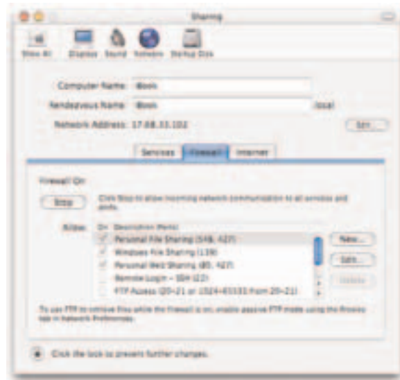
Firewall integrado del Mac OS X

A continuación, puedes configurar fácilmente el Firewall integrado de Mac OS X con la pestaña Firewall de la misma ventana: