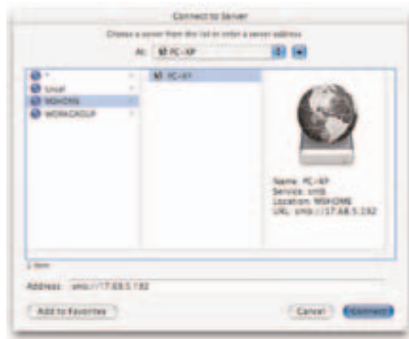
Navegación por dominios y grupos de trabajo Windows

Con esta implementación de cliente/servidor SMB, los usuarios de Mac OS X pueden compartir las carpetas e impresoras conectadas por USB a una red Windows.