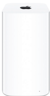
モデル ME918J/A 発表日 2013年6月10日